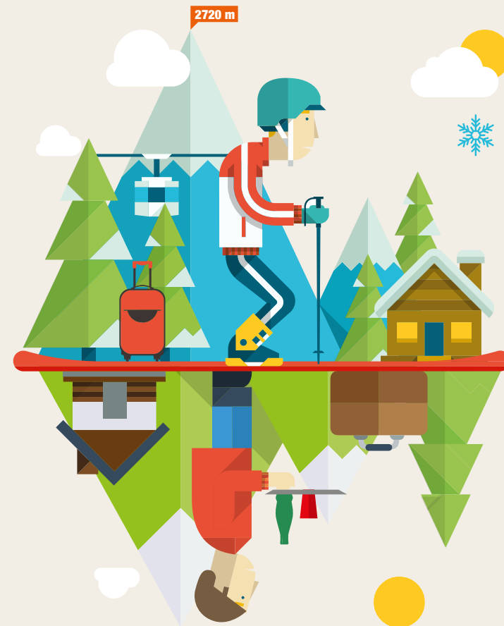
Illustration : © Robert Filip - Fotolia CRÉATION : ATELIER-CONTUREMAISON.COM